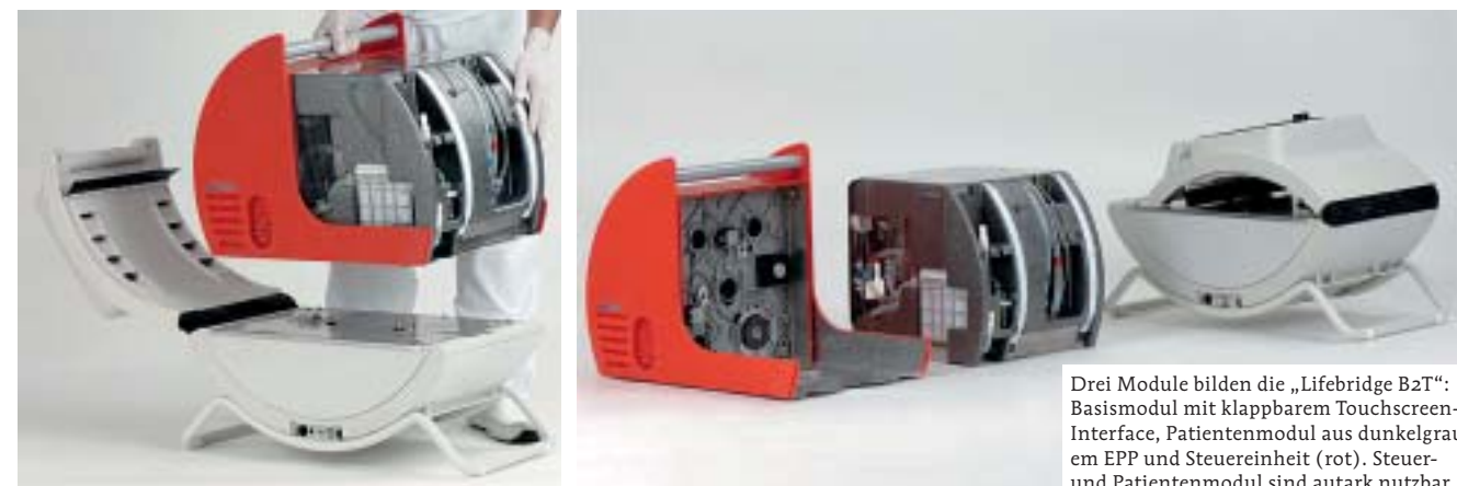
Drei Module bilden die „Lifebridge B2T“: Basismodul mit klappbarem Touchscreen-Interface, Patientenmodul aus dunkelgrauem EPP und Steuereinheit (rot). Steuer- und Patientenmodul sind autark nutzbar.

Nach dem Einsatz gehen Steuer- und Patienteneinheit gemeinsam an Lifebridge, wo das System getrennt, das Patientenmodul entsorgt und ausgetauscht wird, um neu komplettiert wieder zum Rettungsdienst zurückzugehen. Daher ist das Patientenmodul mit seinen EPP-Elementen auf hohe Stückzahlen hin konzipiert. Die Materialwahl und auch die Detailgestaltung der Module standen stets unter der Prämisse, die Reinigung zu erleichtern.