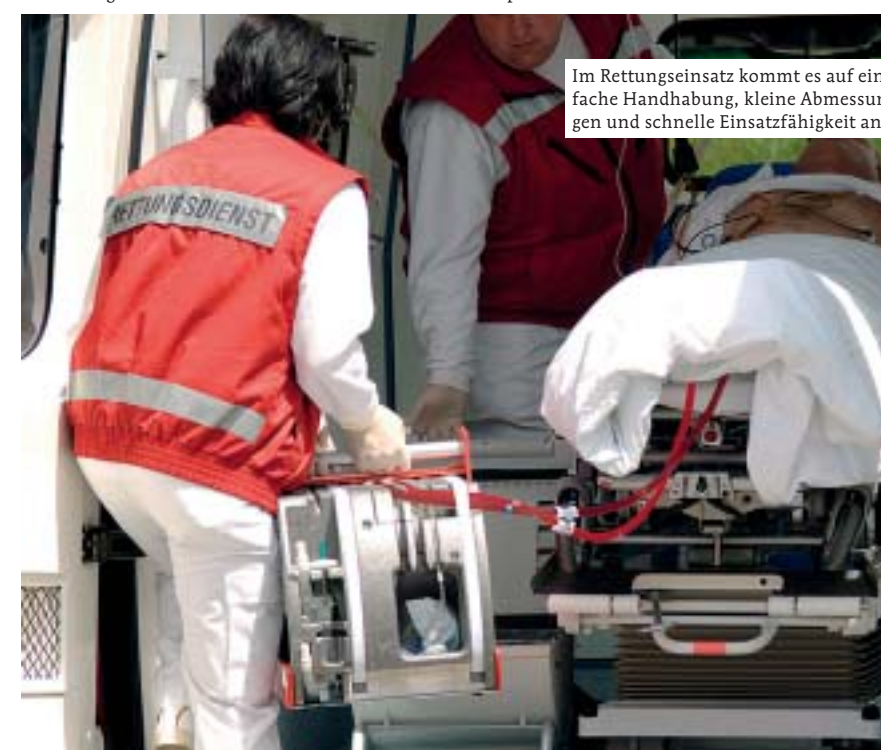
Im Rettungseinsatz kommt es auf einfache Handhabung, kleine Abmessungen und schnelle Einsatzfähigkeit an.

und übernimmt die Lungenfunktion, also die Sauerstoffanreicherung des Blutes. Das Problem: Herz-Lungen-Maschinen sind so sperrig wie komplex und so allenfalls im klinischen Bereich verwendbar, nicht für den Notfalleinsatz vor Ort.