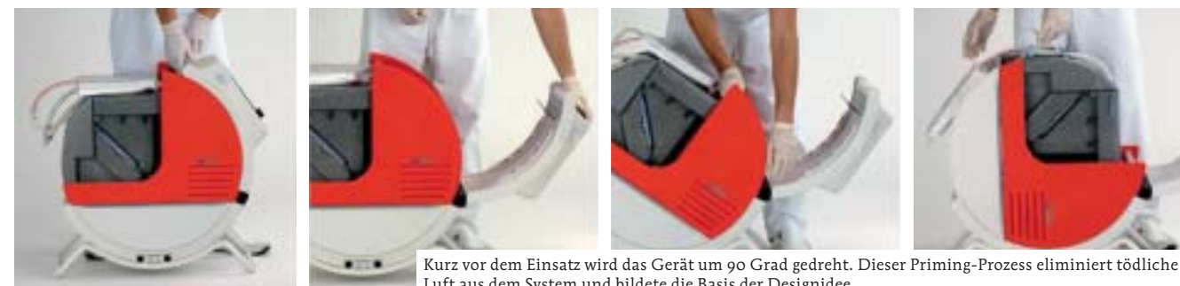
Kurz vor dem Einsatz wird das Gerät um 90 Grad gedreht. Dieser Priming-Prozess eliminiert tödliche Luft aus dem System und bildete die Basis der Designidee.

tern. Daher finden sich wenig Unterscheidungen oder Öffnungen an den Gehäuseteilen, die Lüftungsschlitze sind von innen mit einem Spritzwasserschutz versehen und die Bedienung erfolgt ausschließlich über den Touchscreen und einen kleinen Joystick darunter.