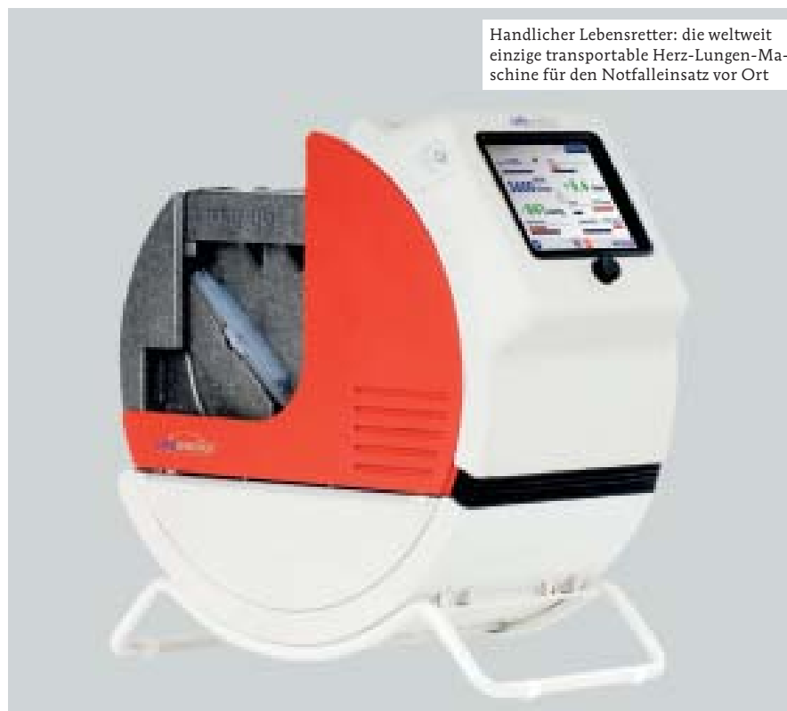
Handlicher Lebensretter: die weltweit einzige transportable Herz-Lungen-Maschine für den Notfalleinsatz vor Ort

Kollabiert das Herz-Kreislauf-System, braucht der Mensch schnell Hilfe. „Lifebridge B2T“, die weltweit erste tragbare Herz-Lungen-Maschine, hält im Notfall die Blut- und Sauerstoffversorgung aufrecht. Technologie und Design kommen aus Deutschland.